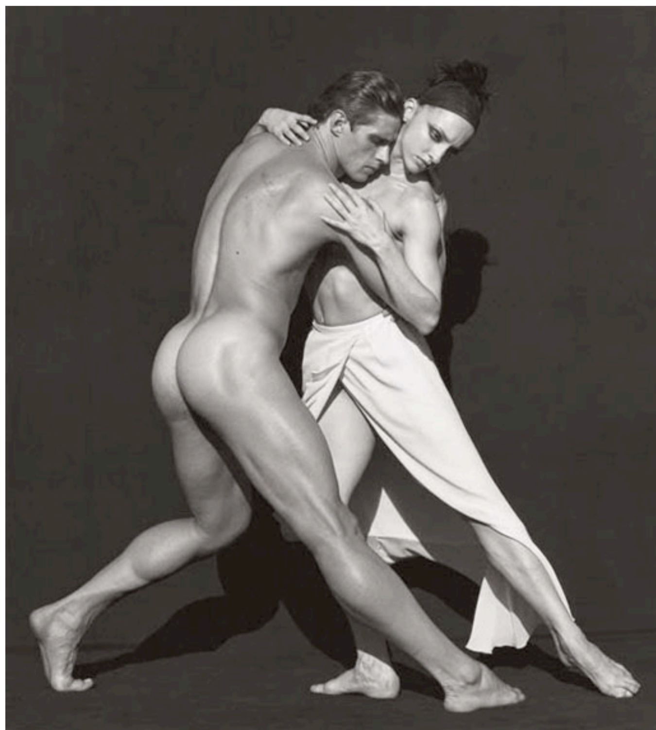
© Herb Ritts, Corps et Ames 19, Los Angeles, 1999

ABOUT US ( HTTP://WWW.PHOTOGRAPHY-NOW.COM/ABOUT#ABOUT_US ) FREE LISTINGS ( HTTP://WWW.PHOTOGRAPHY-NOW.COM/ABOUT#ABOUT_MEDIA ) ADS (RATE CARD) ( HTTP://WWW.PHOTOGRAPHY-NOW.COM/ABOUT#ABOUT_SERVICE ) CONTACT ( HTTP://WWW.PHOTOGRAPHY-NOW.COM/ABOUT#ABOUT_CONTACT ) IMPRINT ( HTTP://WWW.PHOTOGRAPHY-NOW.COM/ABOUT#ABOUT_IMPRINT )