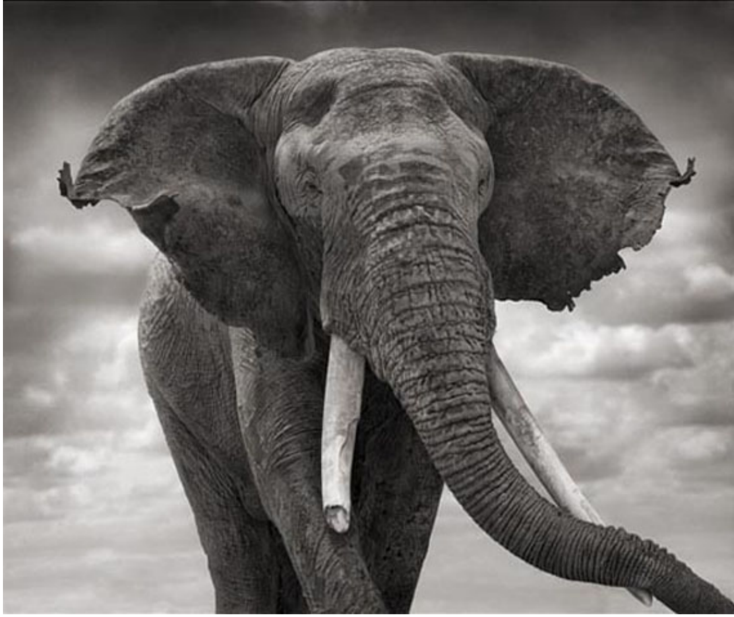
© Nick Brandt · Elephant with Tattered Ears · Amboseli · 2008